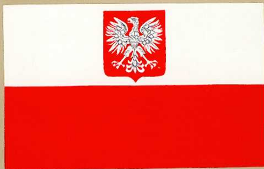
Flaga państwowa z godłem Polskiej Rzeczypospolitej Ludowej

Stosunek szerokości flagi do jej długości - wynosi 5/8