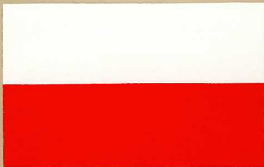
Flaga państwowa Polskiej Rzeczypospolitej Ludowej

Stosunek szerokości flagi do jej długości - wynosi 5/8