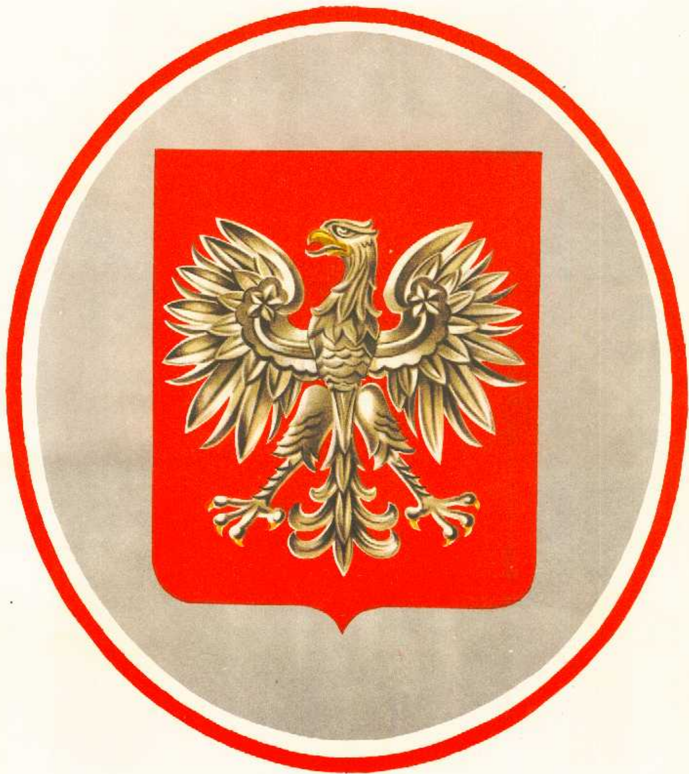
Tabela z godłem Polskiej Rzeczypospolitej Ludowej