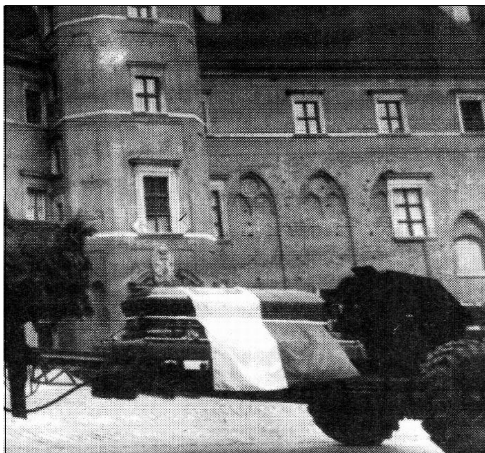
Prochy p. Ignacego Jana Paderewskiego przed Zamkiem Królewskim w Warszawie Trumna umieszczona na lawecie (!), przykryta poprzecznie (!) flag pa stwow Rzeczypospolitej w herbem Orła Białego na białym pasie (komentarz - KJG)

[ ródź: ycie Warszawy z 4-5 lipca 1992 - wycinek w Arch. KJG; u góry - plan ogólny, u doł - fragment z trumn na lawecie]