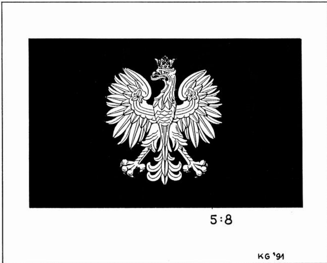
Ryc. 3. Projekt wzoru Chorągwi Rzeczypospolitej na uroczystości pogrzebowe Ignacego Jana Paderewskiego; wizerunek Orła Białego wg projektu prof. Zygmunta Kamińskiego z 1927 r. umieszczony centralnie w polu płachty chorągwi o barwie karmazynu polskiego

[Reprodukcja barwnego wzoru - projekt i grafika: Krzysztof J. Guzek, czerwiec 1991] Studijski projekt autorski KJG wykonany w 1991 r. w ramach prac badawczych nad systemem naczelnych znaków państwowych Trzeciej Rzeczypospolitej; W projekcie połączono idee wzoru chorągwi Rzeczypospolitej z 1919 r. - tj. czerwonej płachty bez żadnej dodatkowej symboliki - z wzorem godła Herbu Orła Białego z 1927 r. Oryginał ryciny - w Arch. KJG]