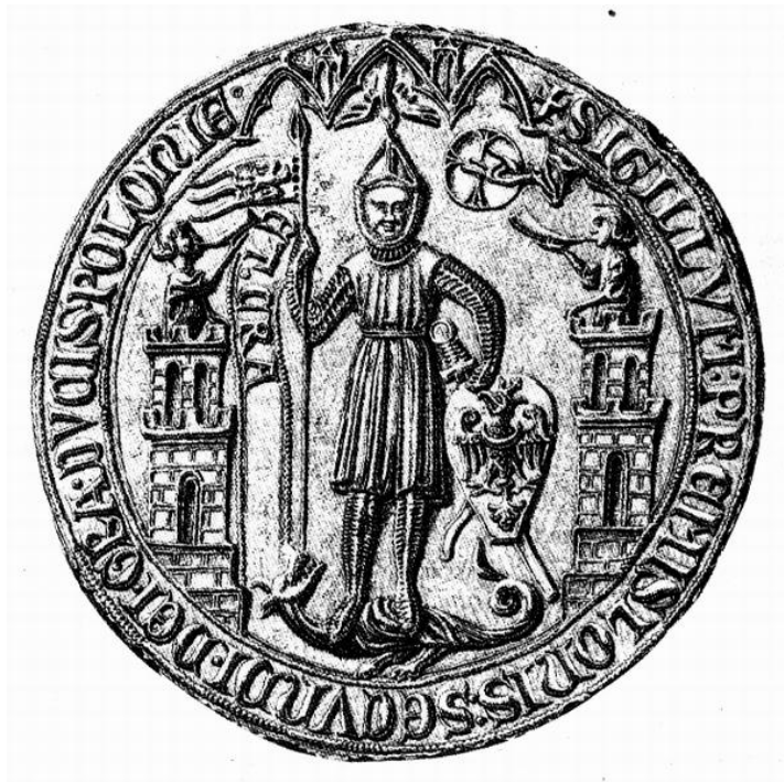
Pieczęć Przemysława II z 1290 r. Przemysława II, księcia wielkopolskiego i krakowskiego.

Podkreślamy w tym miejscu, że rodowód Chorągwi Rzeczypospolitej liczy już ponad 700 lat, bowiem najstarszy znany wizerunek proporcy z ukoronowanym Orłem Białym na pieczęci pochodzi z pieczęci Przemysława II datowanej na 1290 rok. W napisanym wizerunku książca Przemysława II trzyma w prawicy - jako znak książęcej władzy proporzec z orłem białym w koronie, natomiast w lewicy i niżej od proporcy - tarczę rycerską z Orłem Białym, również w koronie - na znak aspiracji do suwerennych, królewskich godności. Dodajmy, że są to najstarsze znane wizerunki ukoronowanego orła białego.